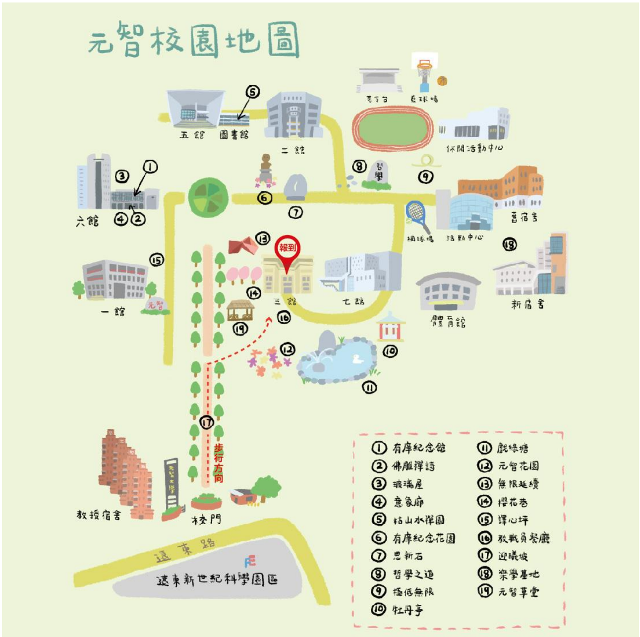
元智大學校區平面圖