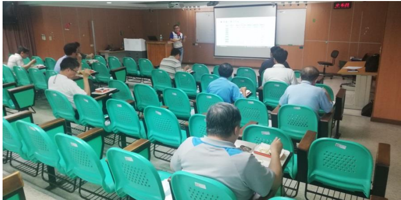
老師熱烈參與活動