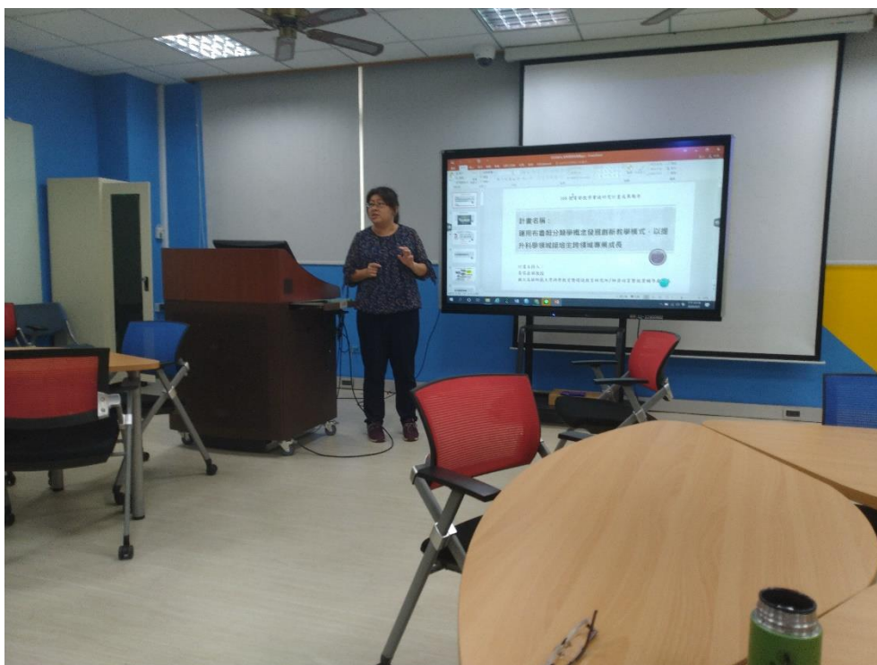
活動剪影 (至少 4 張)